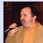
Эстрадные мелодии - в исполнении Феликса Кособурда